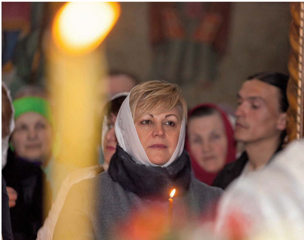
Пасхальное богослужение. 8 апреля 2018 г. Христорождественский собор. Тирасполь.