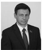
Вадим ЛЕВИЦКИЙ, депутат Верховного Совета

Напомним, что ранее парламент принял поправки в закон «Об обращениях граждан», которым органам власти, различным ведомствам вменено в обязанность принимать обращения граждан на протяжении всего рабочего дня, а в некоторых случаях, к примеру, в милиции – и круглосуточно.