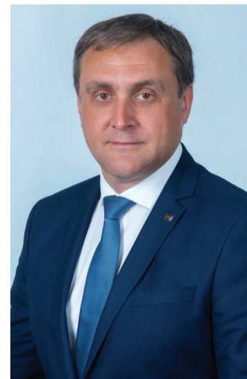
Председатель Верховного Совета

От всей души желаю вам крепкого здоровья, добра, счастья и благополучия!