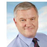
Андрей САФОНОВ, депутат Верховного Совета

Изначально говорилось, что совместные молдо-украинские посты контроля будут выполнять некую функцию учета, теперь взимаются платежи. Следующие шаги могут быть направлены на то, чтобы в полной мере реализовать все фискальные функции, которые могут выполнять молдавские таможенники на территории Украины. Это приведет к тому, что стоимость товаров, поставляемых в ПМР, возрастет, потому что затраты, которые понесут импортёры, будут переложены в конечную стоимость продукции, и в итоге все это будут оплачивать потребители.