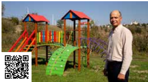
Центр развития ребенка «Золотой ключик» Здесь в прошлом году обновили площадку установив защитное покрытие и игровые элементы на любой вкус.

На округе №14 в Рыбнице в микрорайоне металлургов расположены несколько образовательных учреждений и детских садов, где дети проводят много времени. Например, во дворе дома №43 находится