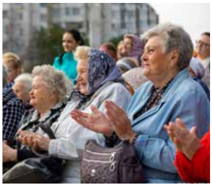
Пожилые люди на празднике.

В перерыве между выступлениями гостей праздника угощали гречневой кашей с тушенкой, сладостями и горячим чаем с лимоном. Теплая атмосфера праздника согрела в этот осенний день всех, кто пришел отметить День пожилых людей.