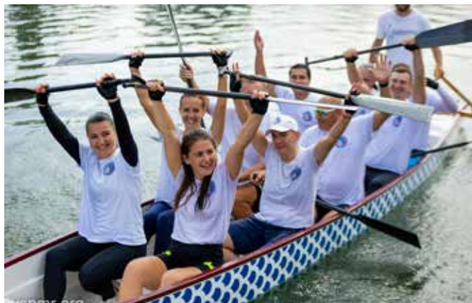
Гребцы работали над техникой гребли и синхронностью.