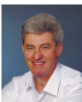
Петр ПАСАТ, депутат Верховного Совета

Петр Пасат подарил библиотеке лагеря комплект книг – издания общественно-политической тематики, художественную литературу, вручил памятные сувениры ребятам, проявившим наибольшую активность в ходе встречи.