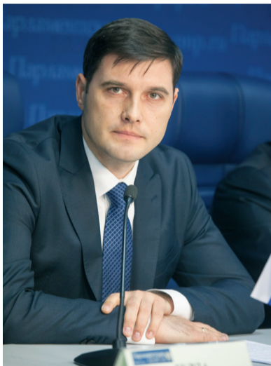
Виктор ГУЗУН, депутат Верховного Совета

Специфика ПМР заключается в том, что республика постоянно находится под внешним давлением, а со стратегическим союзником – Россией – общей границы нет. С 1990 года, со времени создания приднестровской государственности, это давление компенсируется единством народа. Это не значит,