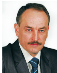
Александр КОРШУНОВ , депутат Верховного Совета

Концепция бюджетной и налоговой политики, безусловно, должна коррелировать и с прогнозом социально-экономического развития, и с ключевыми моментами кредитно-денежной политики. Этого сделано не было. Документ определяет стратегию сокращения государственных расходов, но нужна и стратегия роста экономики.